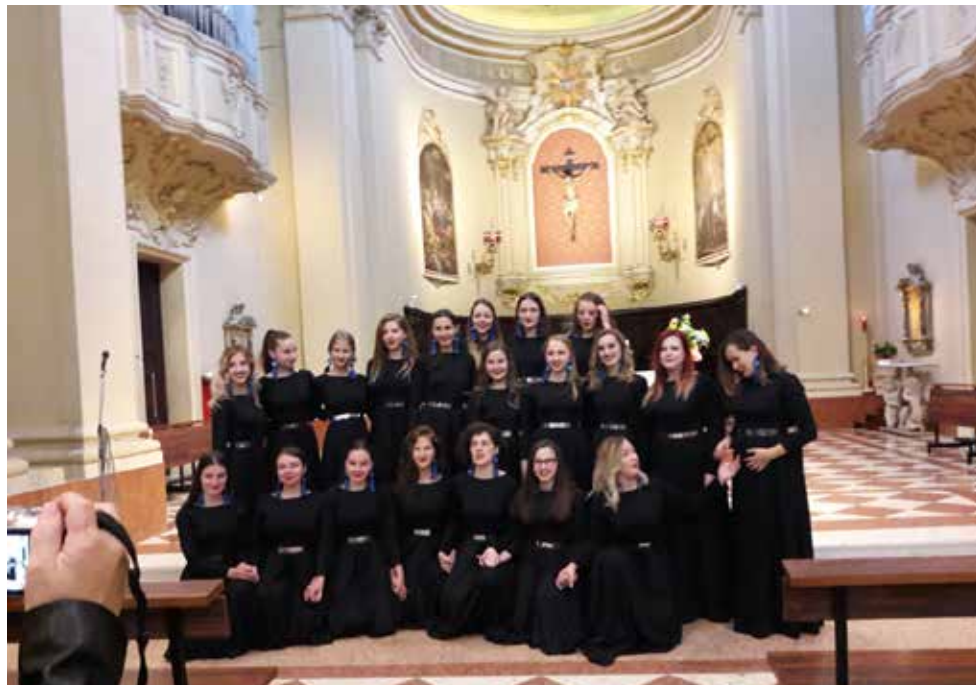
Zboristky v Rímsko katolíckom kostole San Giovanni Battista ( Jána Krstiteľa)

Po dlhej šestnásť hodinovej ceste autobusom nás Rimini privítalo zamračenou oblohou. Spievanky však razom pritiahli slnko, ktoré žiarilo počas nasledujúcich síce chladnejších, ale veľmi pekných septembrových dní. Bývali sme v hoteli necelých 5 minút chôdze od mora, ktoré už bolo príliš chladné na kúpanie. Mohli sme sa tak akurát kochať pohľadom naň pri prechádzkach pobrežím. Pre obyvateľov vnútrozemia, kde sa radíme aj my a pre ktorých nie je more samozrejmosťou, to bol ale veľmi príjemný zážitok. Času na takéto radosti však bolo málo. Naše zboristky využívali každú vhodnú chvíľu na nácvik skladieb a tiež sme sa zúčastňovali aj nepovinných koncertov. Veď sme neprišli do Rimini kvôli turistike, ale nasať atmosféru medzinárodnej speváckej súťaže, prípadne si odniesť nejaké ceny. Tak sa aj stalo. Dievčatá a ich trénerka zaznamenali veľký úspech nielen spevom, ale aj svojim výzorom, vystupovaním a gráciou, ktorá z nich vyžaruje. Roz-