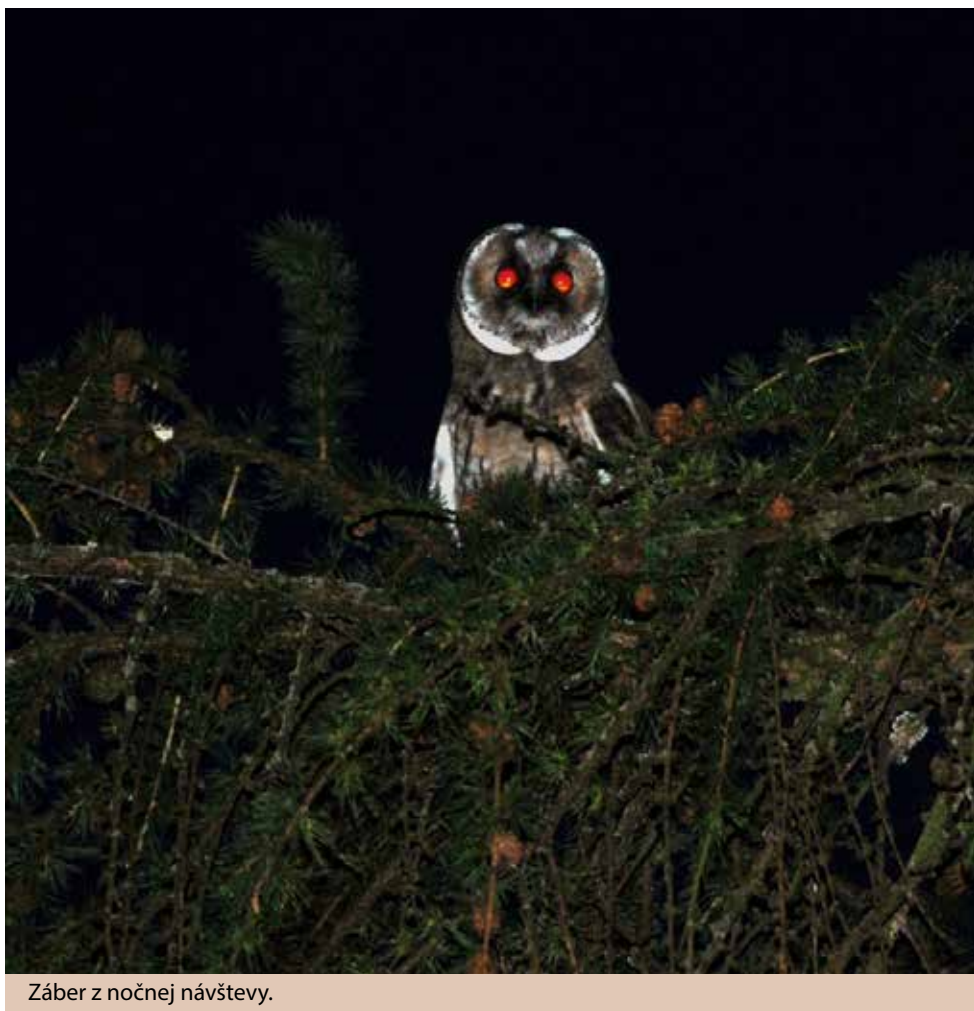
Záber z nočnej návštevy.