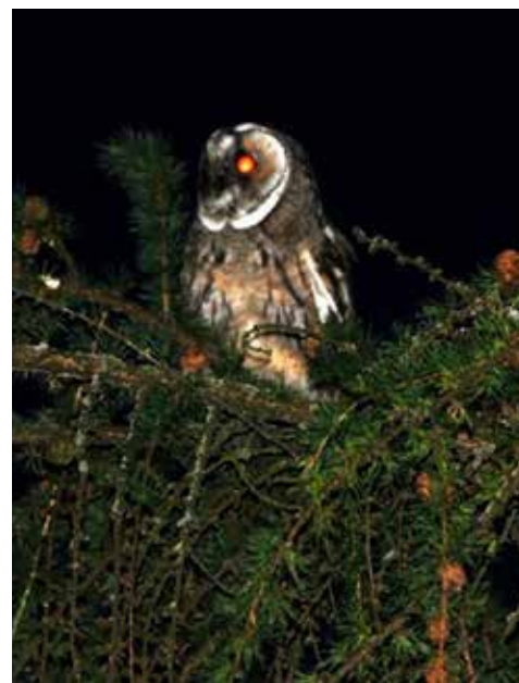
Záber z nočnej návštevy.

priestranstvách, odkiaľ má dobrý výhľad na pohyb potravy. Podľa rozborov kostičiek zozbieraných na miestach jej hniezdenia až 90 percent z nich patrili hlodavcom.