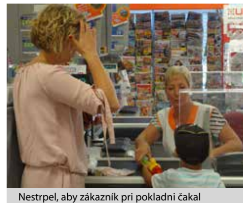
Nestrpel, aby zákazník pri pokladni čakal