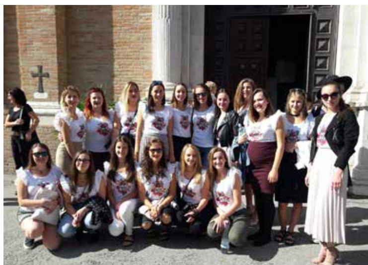
Chvíľa oddychu po namáhavom dni