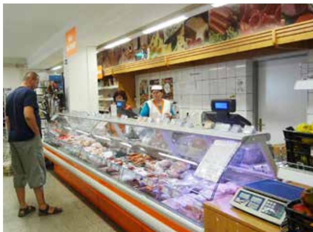
...a stopercentná hygiena.

Hovorí o vás, že ste prísny gazda, vedeli