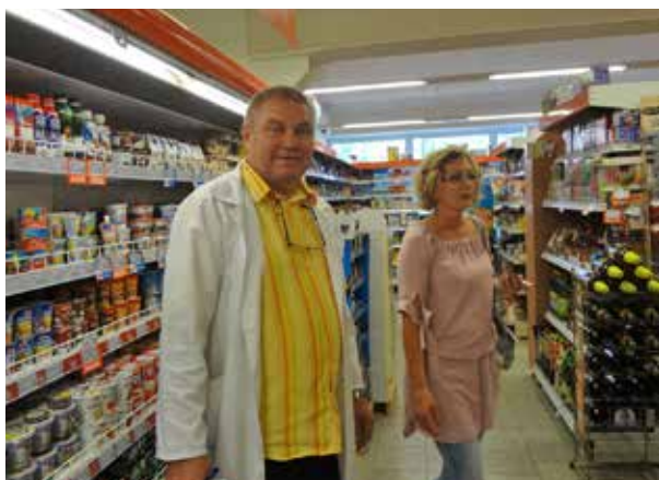
Stanova "latina"- poriadok v regáloch, v skladoch, za pultom,

Takže vaše rozhodnutie prenechať vedenie pracoviska nástupkyňi je definitívne, nadsluhovanie nepripadá do úvahy. Mohlo by